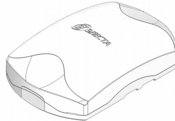
Рисунок 1. Внешний вид прибора

Прибор изготовлен в пластмассовом корпусе (рисунок 1).